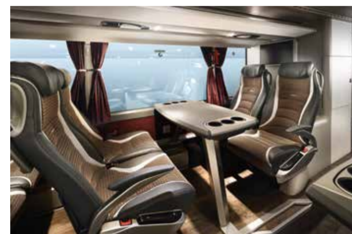
Kommunikative und gemütliche Vis-à-vis-Sitzgruppen gehören im Unterdeck des luxuriösen S 531 DT schon lange zum Zwei-Zonen-Konzept, bei dem im Oberdeck gediegene Ruhe herrscht und das Unterdeck der Geselligkeit vorbehalten ist.