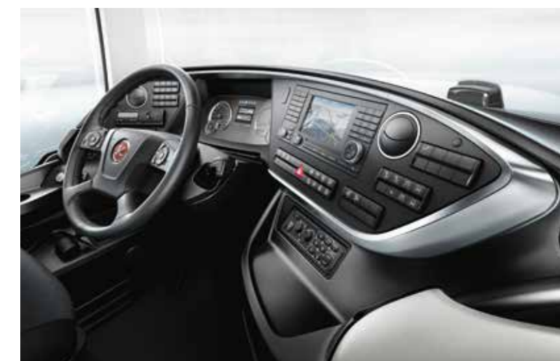
Ein absolutes Highlight des Fahrzeuges sind die beiden wählbaren Cockpits, die entweder auf Linieneinsätze oder aber auf höchsten Komfort und Luxus hin optimiert sind. Funktionalität und Ergonomie sind dabei immer vom Feinsten.

Setra ist der Inbegriff von gehobenem Reisekomfort. Das breit gefächerte Modellangebot der ComfortClass und der TopClass lässt mit 10,5 und 15 Metern Länge und zwei Höhen keinerlei Wünsche offen. Ebenso beeindruckend ist der Umfang der möglichen Individualisierungsmöglichkeiten. Die vielfältige Sitzpalette stammt aus eigener Fertigung und ist auf dem Markt einzigartig. Luxusdetails mit echtem Kundenerwartungswert, wie die beheizte Fensterbrüstung, sind sogar ausschließlich bei Setra zu bekommen und unterstreichen die Exklusivität der Marke nochmals.