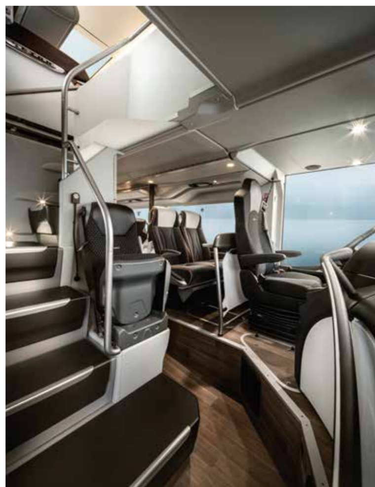
Die ebenfalls erhältliche Fernlinien-Variante des Doppeldeckers S 531 DT bietet auf Wunsch den hell und freundlich gestalteten, leicht zu begehenden Aufstieg direkt hinter dem Einstieg rechts. Das bietet ein Plus an Sicherheit.