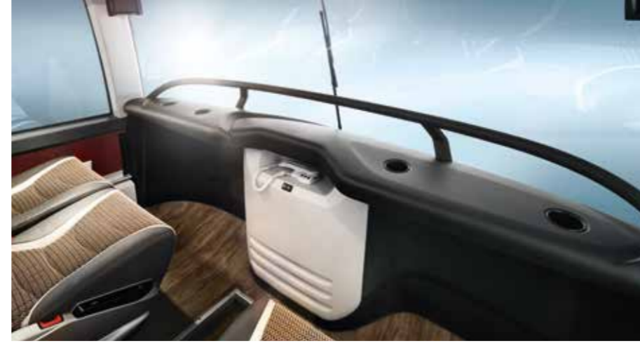
Hinter der neu gestalteten Front des Doppeldeckers mit dem oberen Scheibenwischer in aerodynamischer Race-Position verbirgt sich eine der begehrtesten Sitzreihen in der Buswelt – sie wurde ebenfalls mit neuem Cockpit aufgewertet.