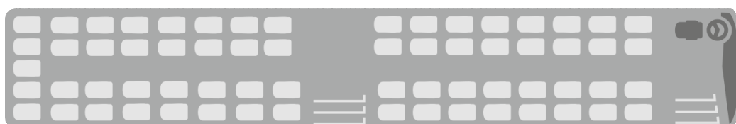
Variante 1: S 419 UL - 65 Sitze