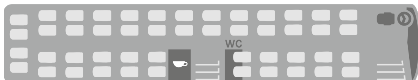
Variante 2: S 516 HD - 4 Sterne - 48 Sitze - Klasse 3 + WC + Bordküche